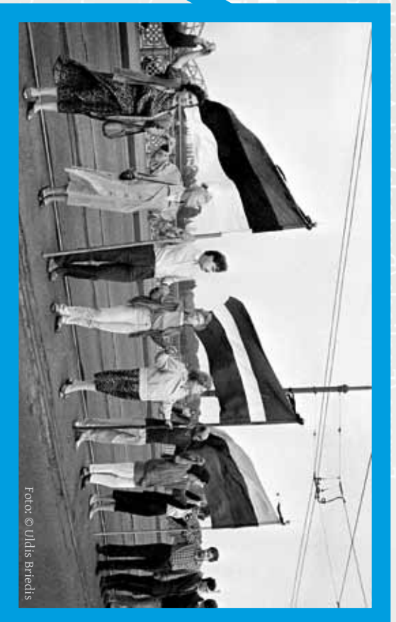
23. August 1989, Baltischer Weg in Lettland

Der Thememonat „30 Jahre Mauerfall“ wird mit Unterstützung und in Zusammenarbeit mit folgenden Institutionen ausgerichtet: