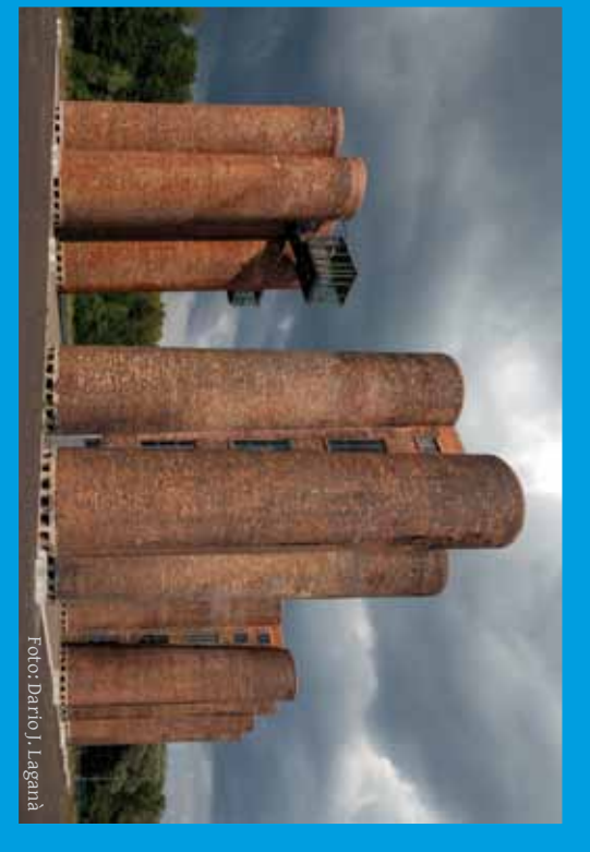
Ausstellung »DEUTSCHLAND ÜBERGESTERN«