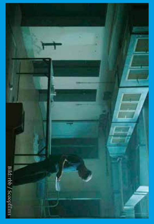
Dokumentarfilm »Honeckers unheimlicher Plan«