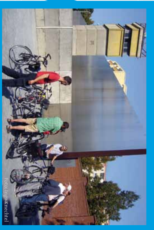
Bernauer Straße, Gedenkstätte Berliner Mauer